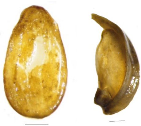
Graine et fragment de capsule imbibées de lin cultivé.

Un ruisseau, son environnement végétal et son utilisation à l'époque gallo-romaine à Montaigu-la-Brisette "Le Hameau Dorey" (Manche) : apports de l'étude carpologique.